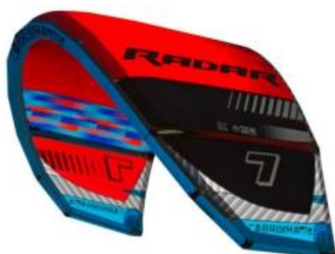
Color # 001