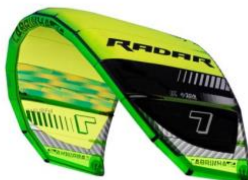
Color # 002